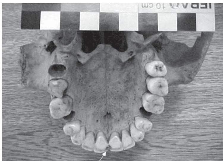
Figura 3 - Paleopatologia dentária (cáries nos incisivos centrais), Sítio Furna do Estrago, Brejo da Madre de Deus, Pernambuco.