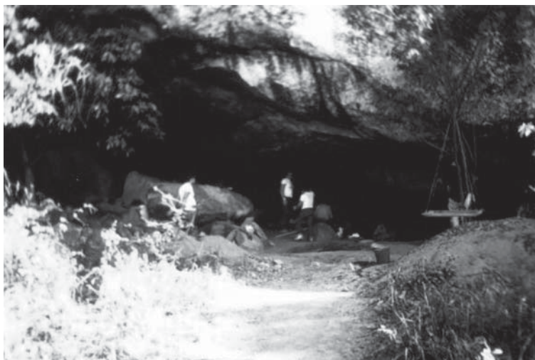
Figura 1 – Sítio Furna do Estrago, Brejo da Madre de Deus, Pernambuco.

sitos de cálcio, alterações por causa químicas, mudanças de coloração e mudanças causadas por intemperismo, como também sinais patológicos (ósseos e dentários), conforme o proposto por Buikstra e Ubelaker (1994) e Botelha et al. (2000).